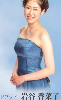
(掛川市出身) 東京藝術大学音楽学部 2 年在学中