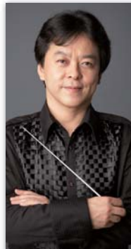
須川 展也 指揮&amp;サクソフォン独奏 Nobuya Sugawa

東京藝術大学卒業。第51回日本音楽コンクール、第1回日本管打楽器コンクール最高位受賞。出光音楽賞、村松賞を受賞。1998年、J T音楽家シリーズ TVCM出演。2002年、NHK連続テレビ小説『さくら』のテーマ曲を演奏。名だたる作曲家への委嘱を積極的に行っており、その作品の多くがクラシカル・サクソフォンの主要レパートリーとして国際的に広まっている。1989年から2010年まで東京佼成ウインドオーケストラ・コンサートマスターを務めた。2014年にデビュー30周年を迎え、東京文化会館大ホールでの記念公演は完全売切の大盛況となった。