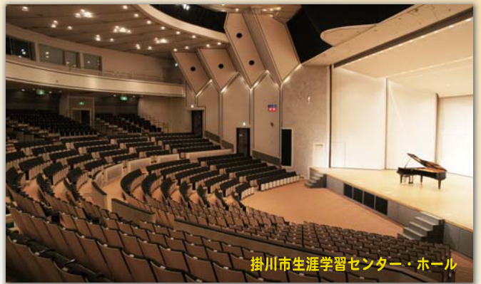
掛川市生涯学習センター・ホール

掛川で製造され、世界に送り出されているコンサートグランドピアノと 同じく中東遠の豊岡で製造されている管・打楽器が織りなす“オト”の世界。 ピアノソロで聴くクラシックの名曲から、吹奏楽のオリジナル作品、 日本が世界に誇るサクソフォニストによる独奏、ポップスナンバーまで、 多彩なプログラムで贈る感動の音楽空間をどうぞお楽しみください。