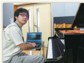
(写真) ヤマハ掛川工場にて

愛知県名古屋出身。大学では建築音響を専攻し、2004年、京都大学工学研究科修士課程修了。ピアノ演奏歴として、1996年、第50回全日本学生音楽コンクールピアノ部門全国大会第1位、同グランプリコンサートin福岡出演。2003年、フランス・ナンシーにて夏期講習会を受講。2008年、第17回ABC新人コンサート・オーディション合格、同コンサート出演。ヤマハでは入社時よりピアノ設計に従事し、主にXAシリーズ(現在は廃番)、CFシリーズの開発、立ち上げ等に関わる。2011年からの2年間ドイツのヤマハ販売YMEに駐在し、音楽文化の奥深さや楽器の変遷などを身近に学ぶ機会を得た。現在、ヤマハ株式会社に勤務。所属は楽器開発統括部 楽器技術開発部 FPG。磐田市在住。